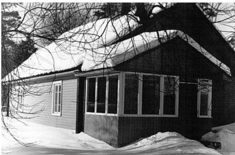
Kolhoosi kontor 1948. a.