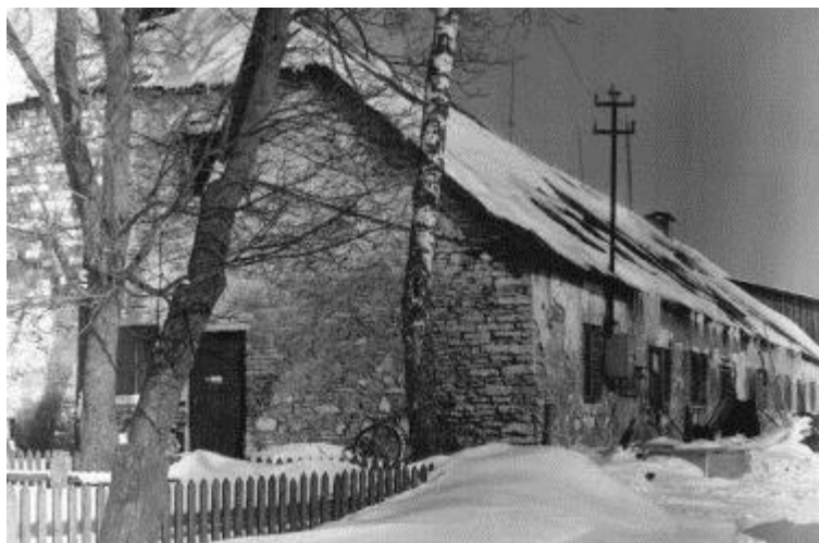
Kolhoosi lehmatalu. (, 1987)